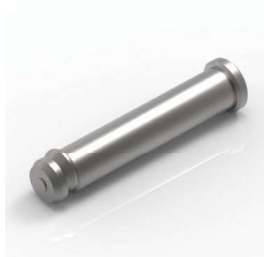
Pin zabezpieczający Security Pin