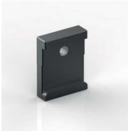
Forma - A (Lewa) Form - A (Left)

Sruby V8 / V12 str. 742 Screws V8 / V12 page 742